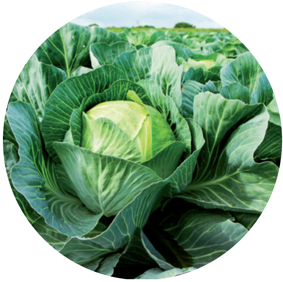
HOF WULHORST Gemüse, Kohl, Salate 45731 Waltrop