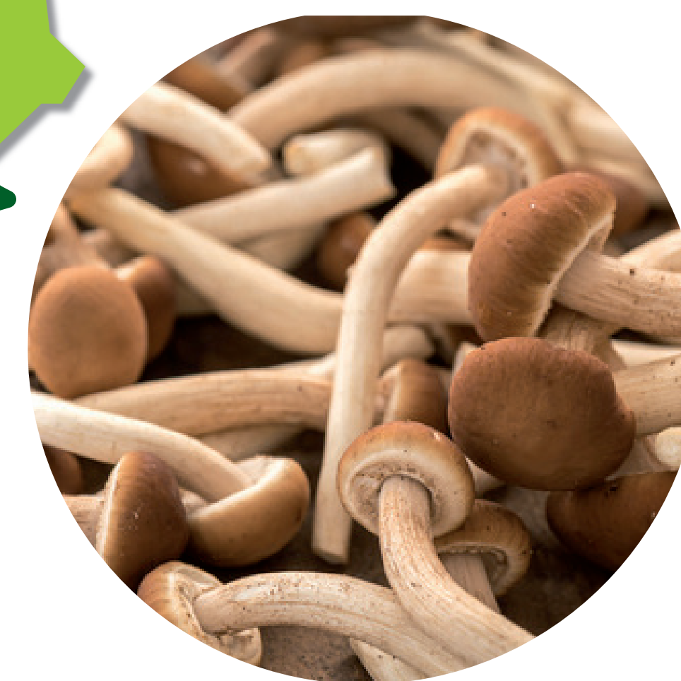
PILZHOF AM HELLWEG Shitake und Kräutersaitling 58730 Fröndenberg