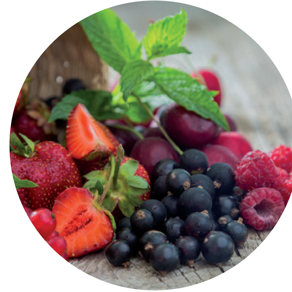
HOF GROTHUES-POTTHOFF Beeren und Äpfel 48308 Senden