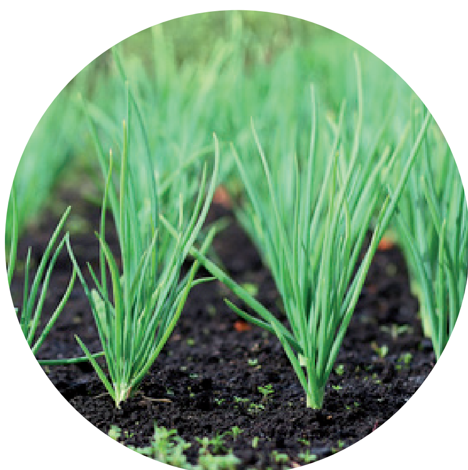
HERRMANN Frische feine Kräuter 48461 Neuss