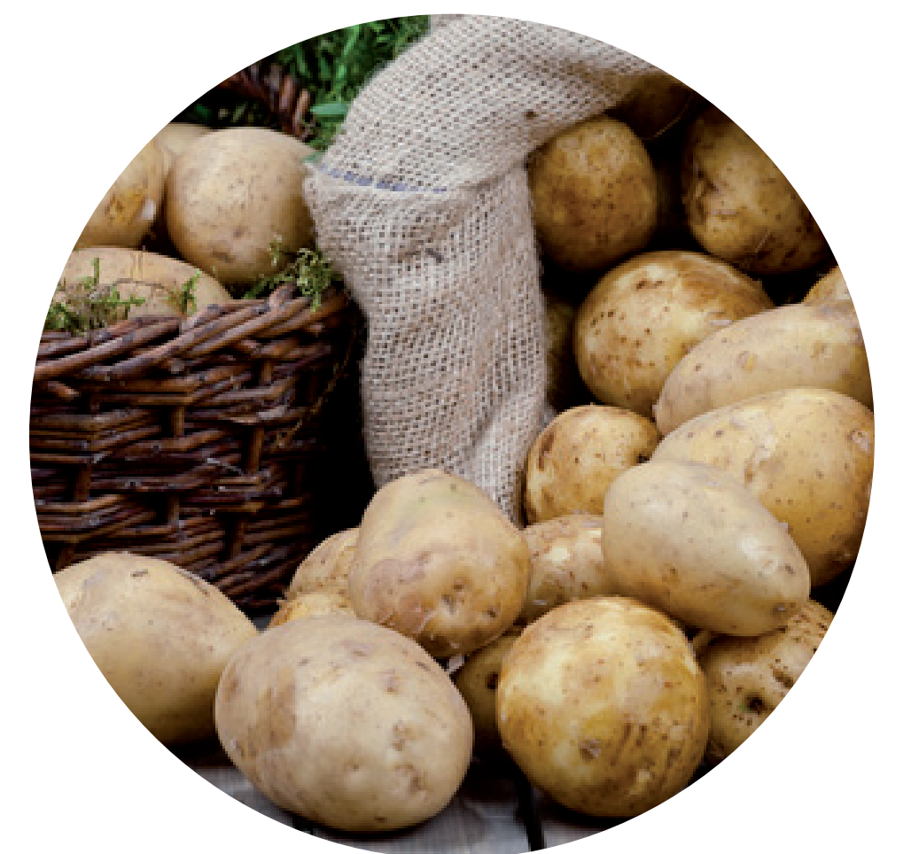
MÜNSTERLAND KNOLLE Kartoffelverarbeitung 48368 Sassenberg