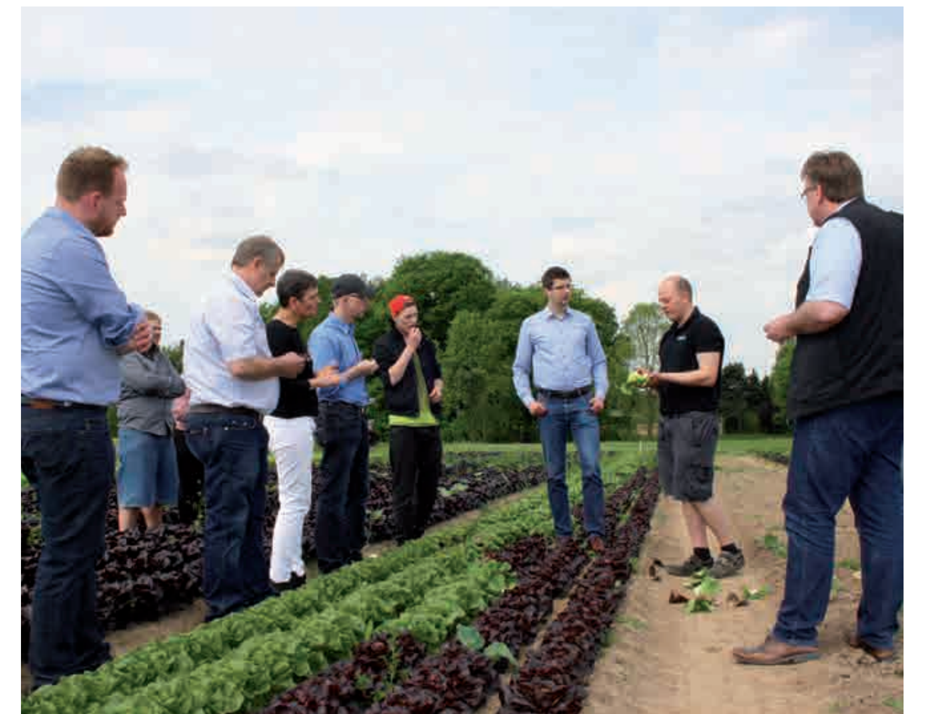
Vor Ort, Infos direkt vom Erzeuger

Hier arbeiten echte Landwirte, die im Umgang mit der Natur, den Produkten und den Maschinen so umweltgerecht wie möglich tätig sind, das wurde von der Pike auf gelernt.