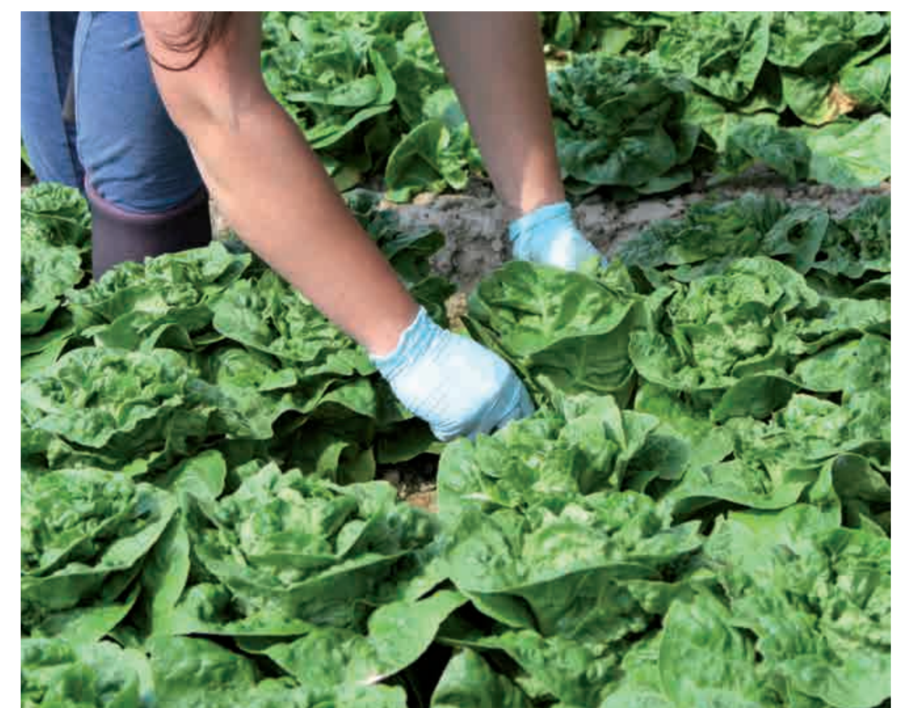
ACG-zertifiziert, faire Produktion, zufriedene Mitarbeiter