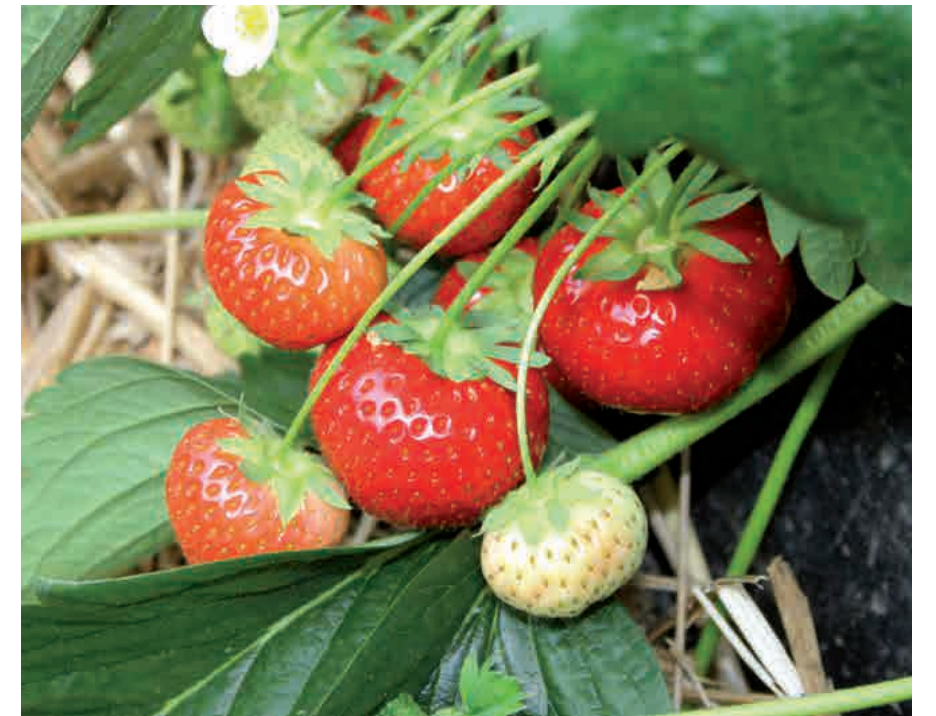
Handverlesene Qualität, frische Früchte mit vollem Geschmack

Mit einem zusätzlichen Hektar Freilandfläche verfügt der Erdbeerhof Kleiner über 90.000 m 2 , das entspricht ca. 13 Fußballfeldern. Heute arbeiten hier in der Saison über 125 Mitarbeiter von Ende April bis Anfang November.