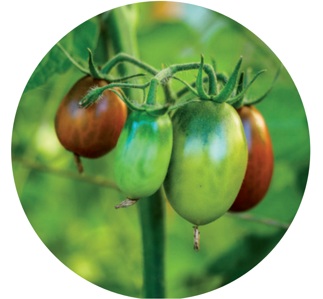
HOF RUNTENBERG Tomatenbetrieb 48167 Münster