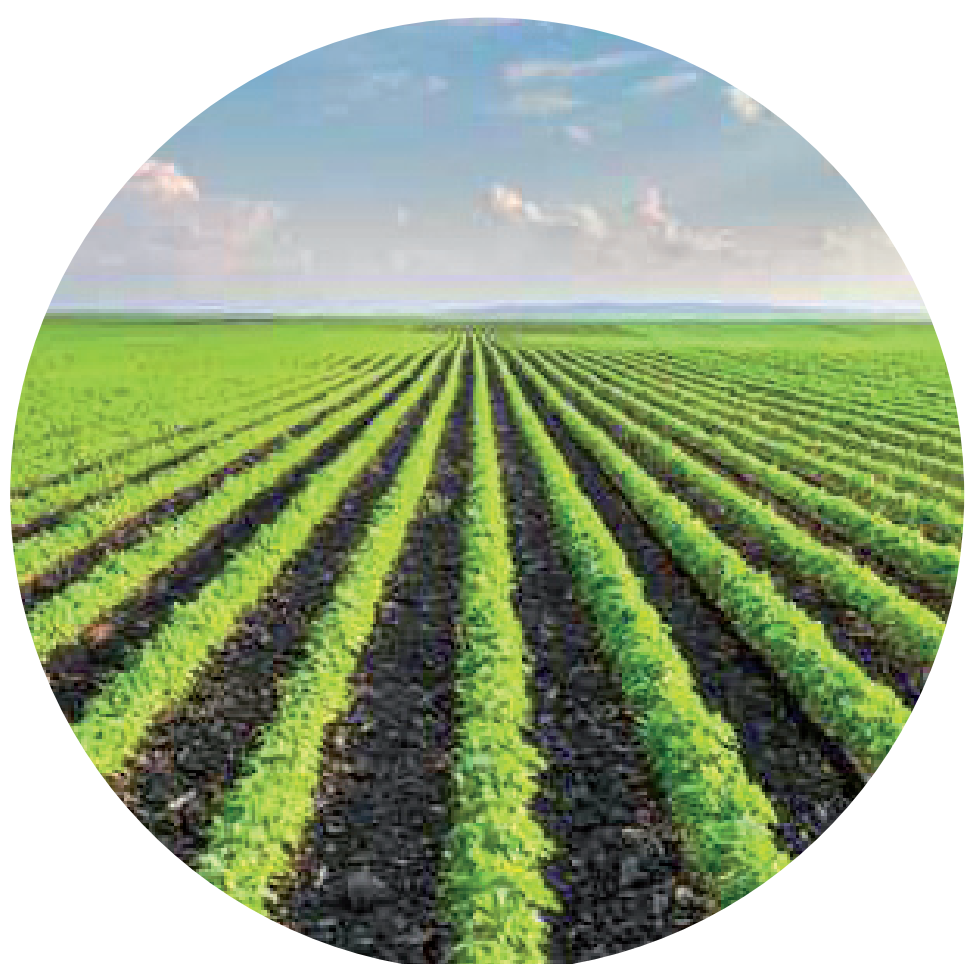
HOF GOER Eisbergsalatproduktion 45731 Waltrop