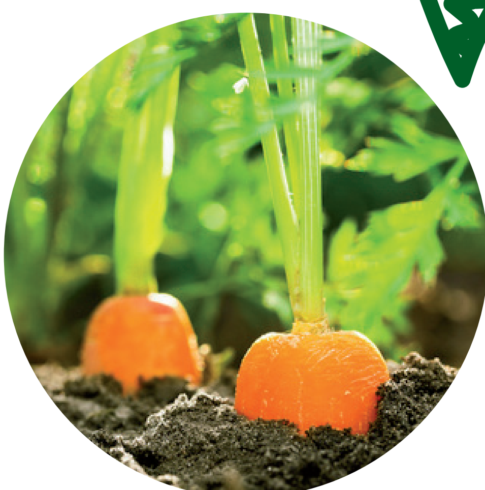
ABENHARDT Möhren 48368 Datteln