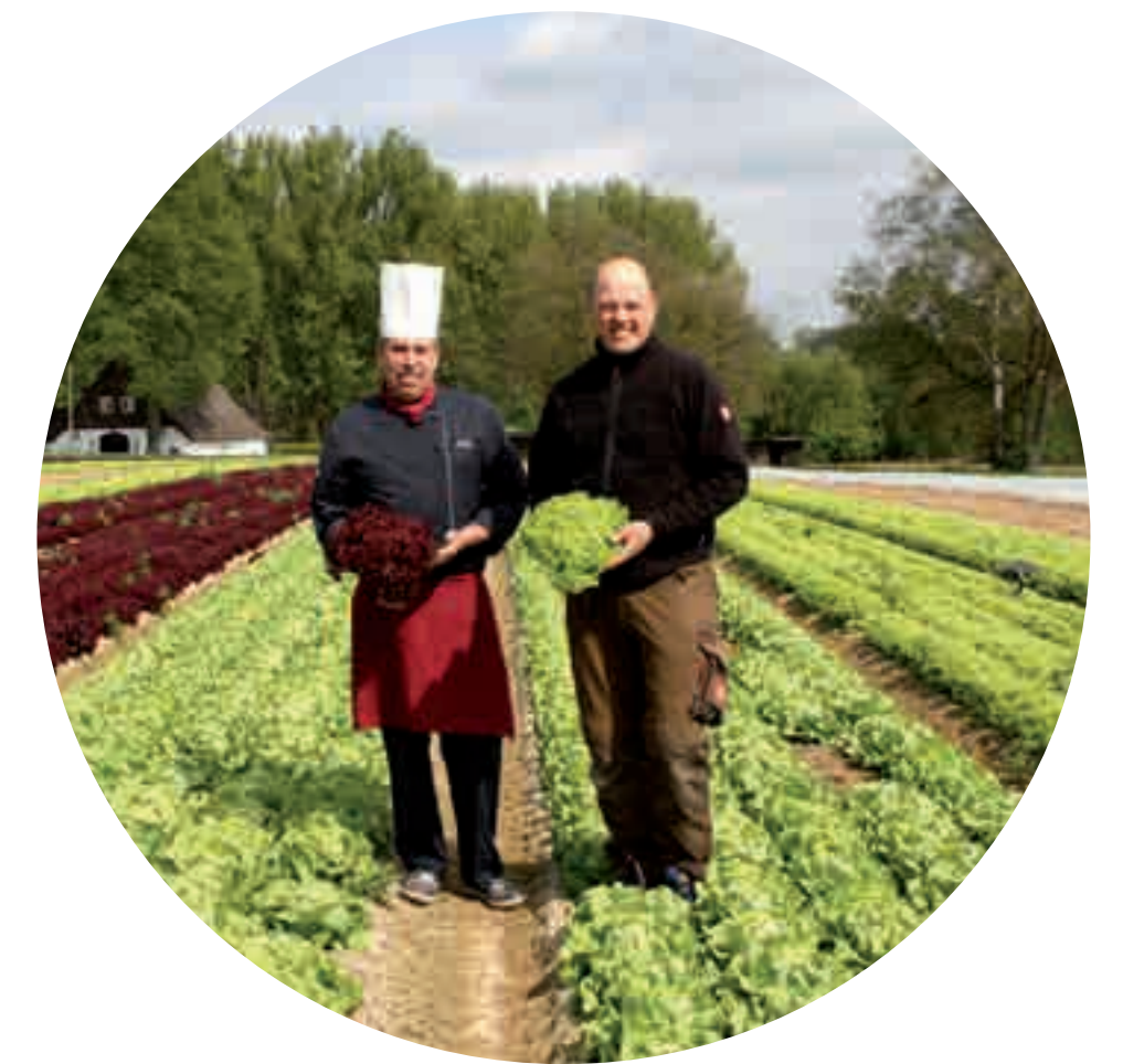
FRISCHE AUS WESTFALEN Gemüse und Salat 33739 Bielefeld