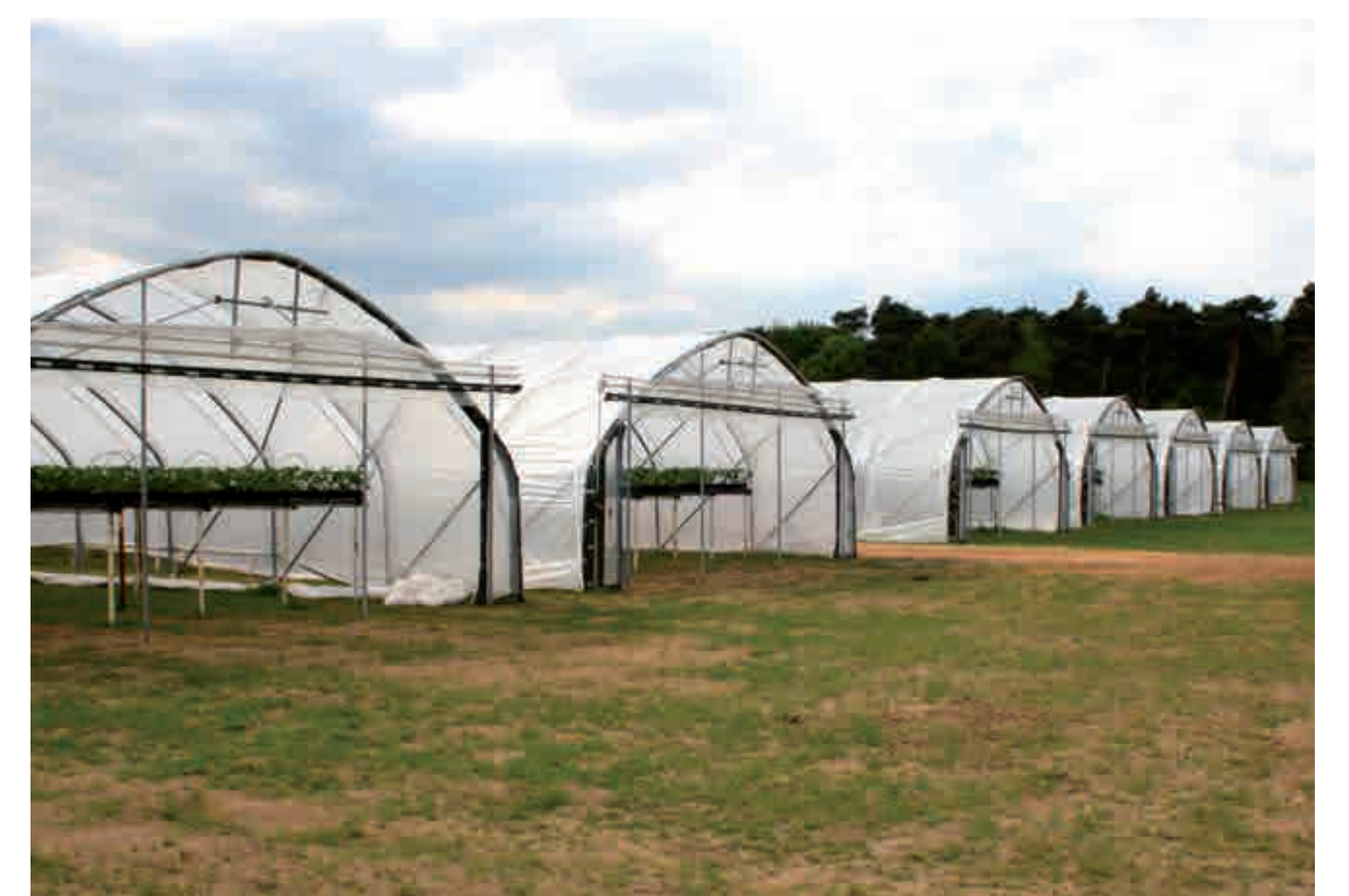
6 Hektar mit Stehlagen für eine schonende und saubere Ernte