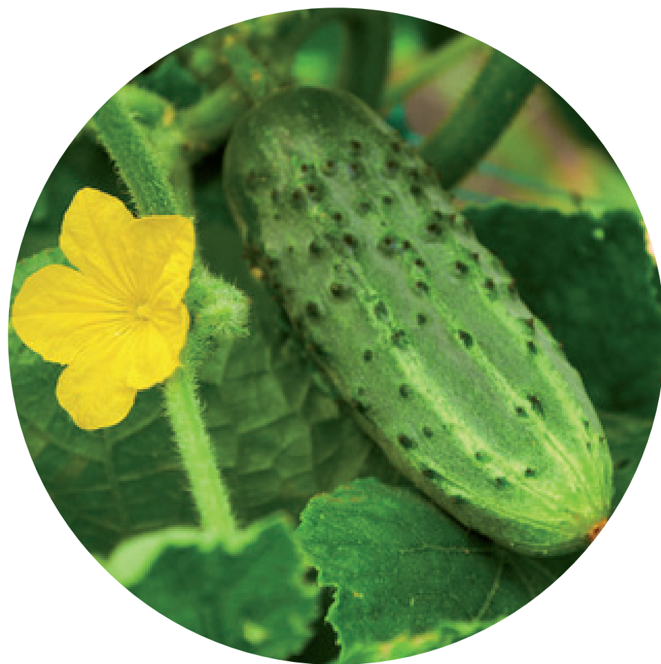
HOF SCHRÄDER Gurken und Tomaten 48269 Greven